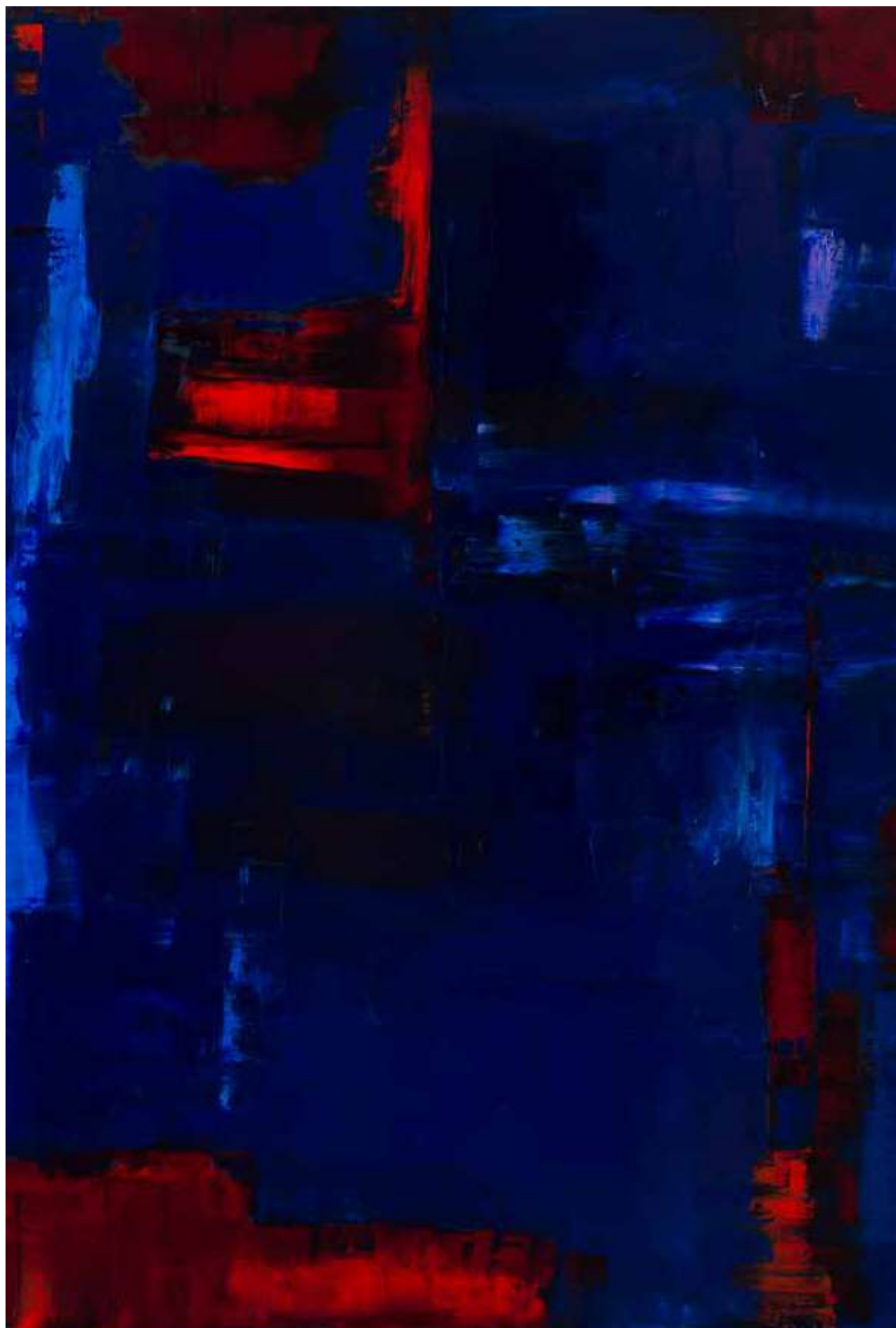
Reflection: Red On Blue – 2016 Fast Co-Exist Collection 2m x 1.9m Oil on canvas