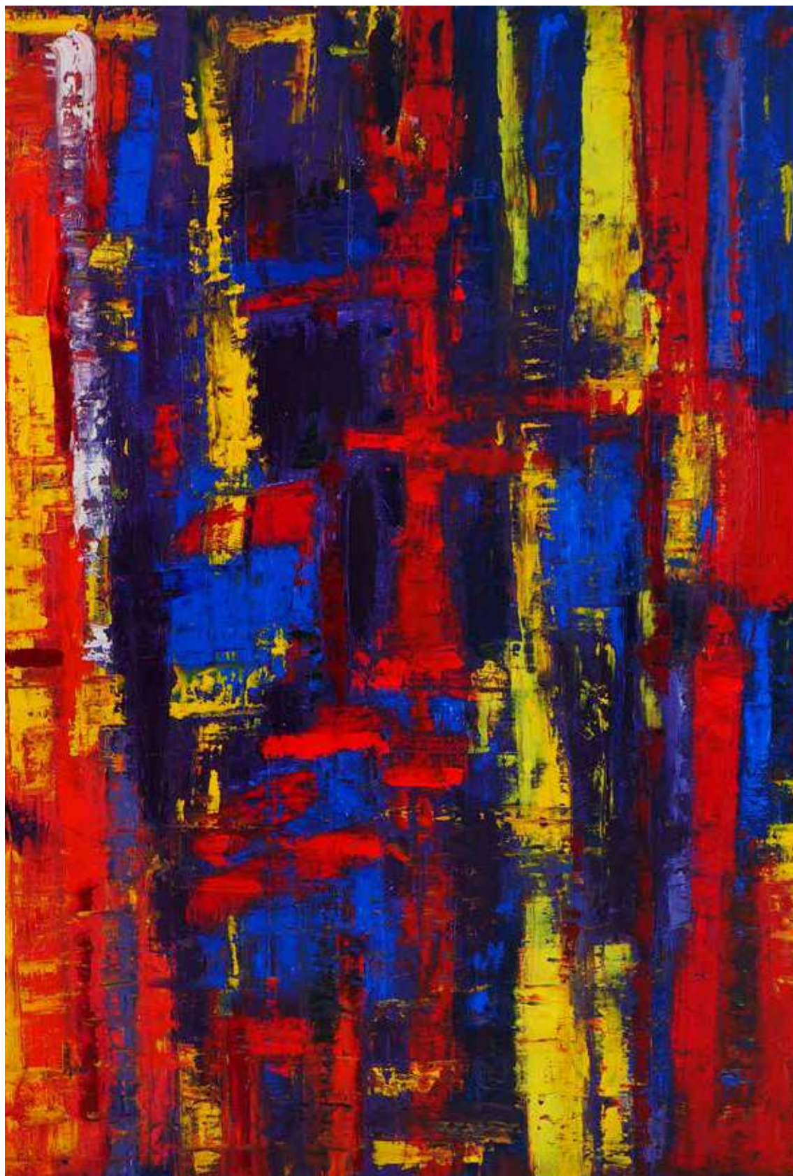
Reflection: Red, Yellow on Blue – 2015 Fast Co-Exist Collection 2m x 1.7m Oil on canvas