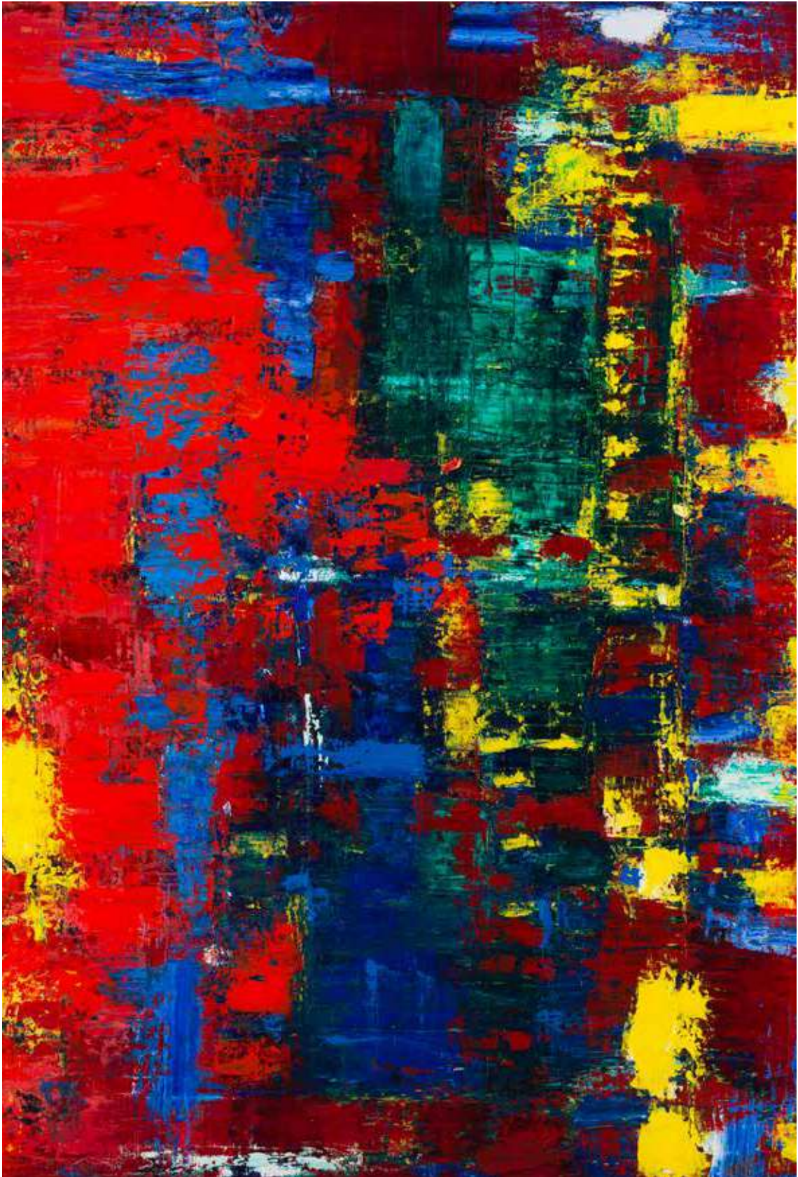
Reflection on Techni-Colours – 2017 Fast Co-Exist Collection 2m x 1.9m Oil on canvas