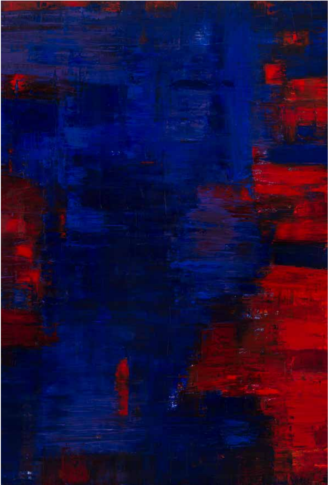
Reflection: Purple on Red – 2015 Fast Co-Exist Collection 2m x 1.9m Oil on canvas