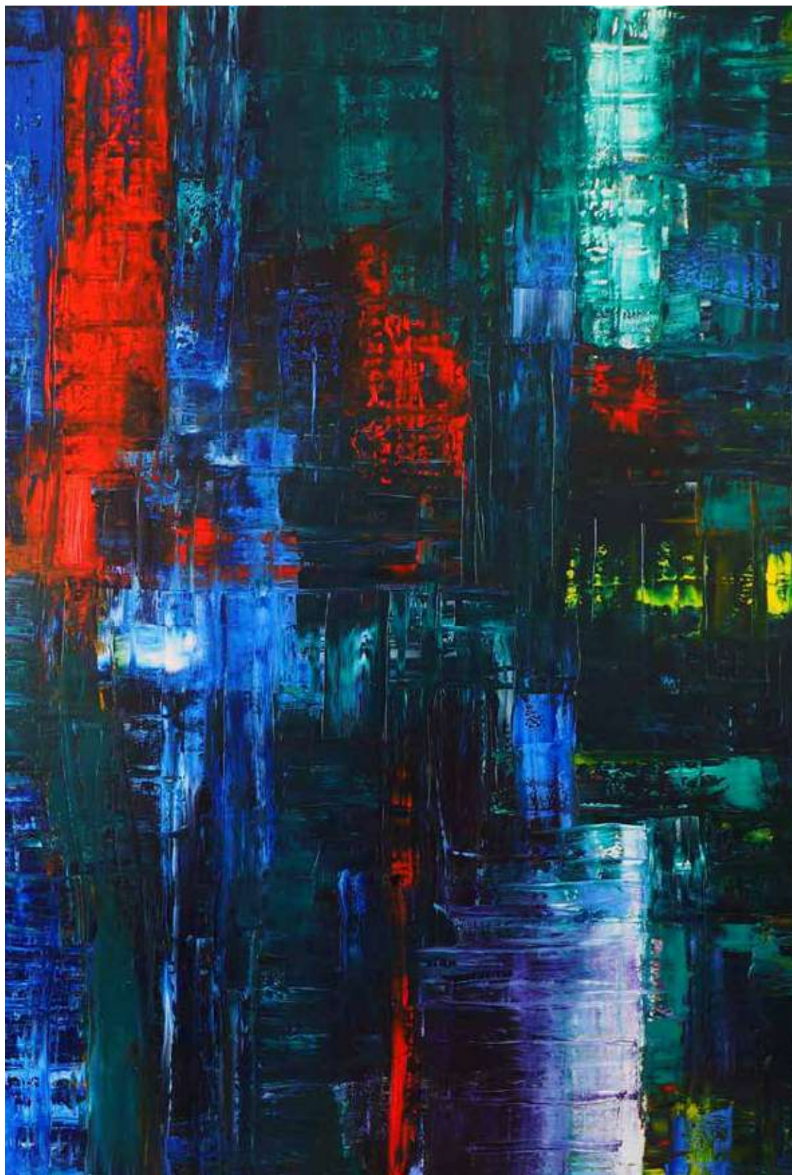
Reflection: Blue, Green, Red, Yellow – 2015 Fast Co-Exist Collection 2m x 1.9m Oil on canvas