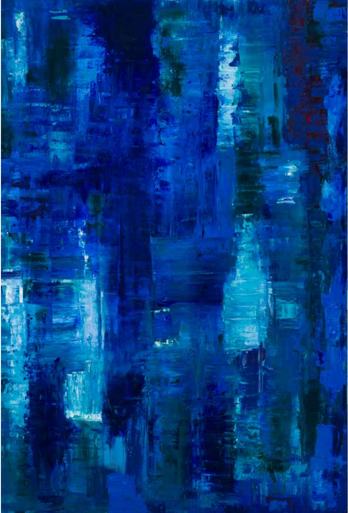
Reflection: on Blue – 2015 Fast Co-Exist Collection 2m x 1.7m Oil on canvas