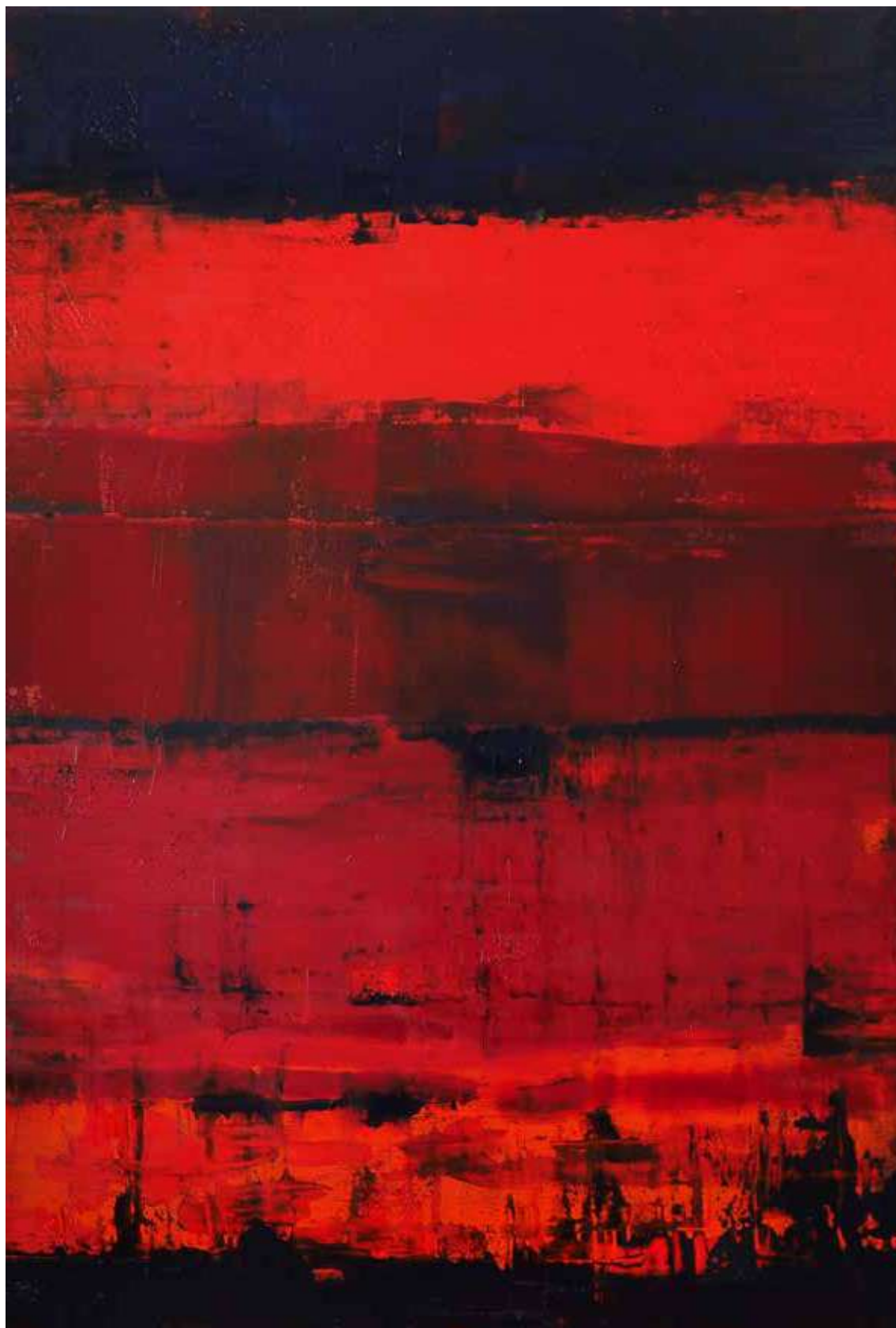
Reflection: on Red – 2015 Fast Co-Exist Collection 2m x 1.9m Oil on canvas

International Award winner Contemporary Art of Excellence 2017 Investable artists.